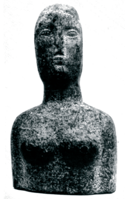
Prof. Stanisław Horno-Popławski Młodość, 1965, MNW